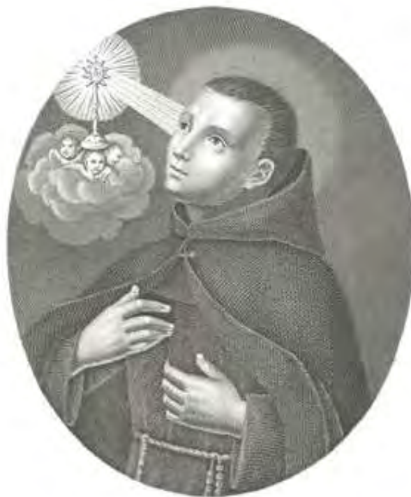
S. PASQUALE BAYLON

In Villa Reale, in Spanien, der heilige Paschalis vom Orden der Minderbrüder, ein Mann von wunderbarer Unschuld und Buße, der von Papst Leo XIII. zum himmlischen Patron der Eucharistischen Kongresse und der Vereinigungen zu Ehren der heiligsten Eucharistie erklärt wurde.